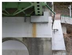
船上から確認できない……