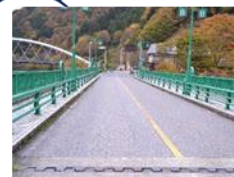
点検車が使えない……