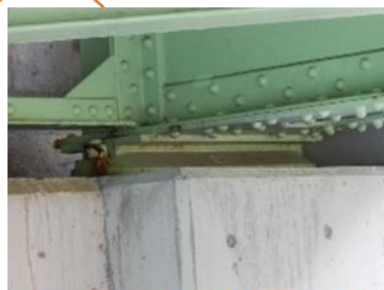
足場が無くても、支承の状況を確認出来る