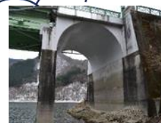
側面から確認できない……